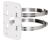
PFA152 Dispositif de montage sur mât