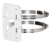
PFA137 Boîtier de raccordement