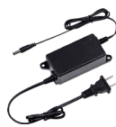
PFM320 Adaptateur d'alimentation 12 V 2 A