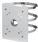
PFA150 Dispositif de montage sur mât