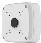
PFA121 Boîte de raccordement