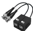
PFM800-E Symétriseur HDCVI passif