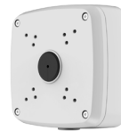
PFA121 Boîte de raccordement