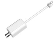
LR1002 Convertisseur ePoE sur câble coaxial