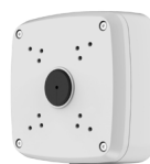
PFA121 Boîte de raccordement