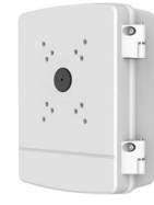
PFA140 Boîtier d'alimentation étanche