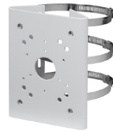
PFA150 Montage sur poteau