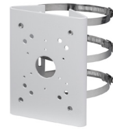
PFA150 Montage sur poteau