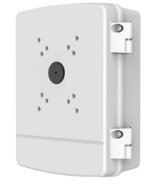
PFA140 Boîtier d'alimentation étanche