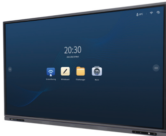
Tableau blanc Interactif Intelligent UHD 65/75/86 po