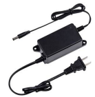
12 V CC/2 A Adaptateur secteur