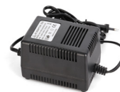
24 V CA/3 A Alimentation Électrique